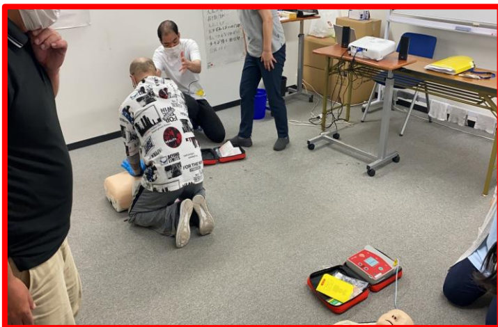
医療的ケア演習（蘇生法）