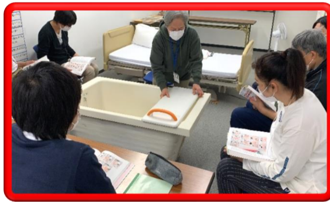
生活支援技術 (入浴)