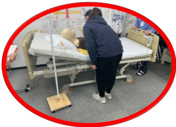
医療的ケア演習 (経管栄養演習)